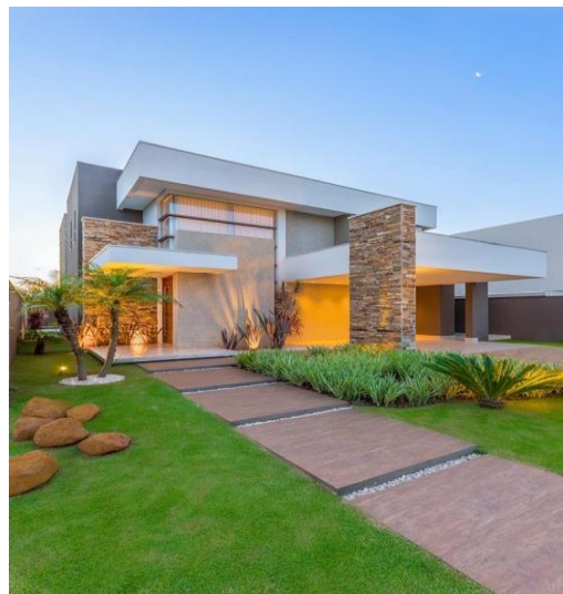
Figura 2: Foto de casa tirada da revista viva decora