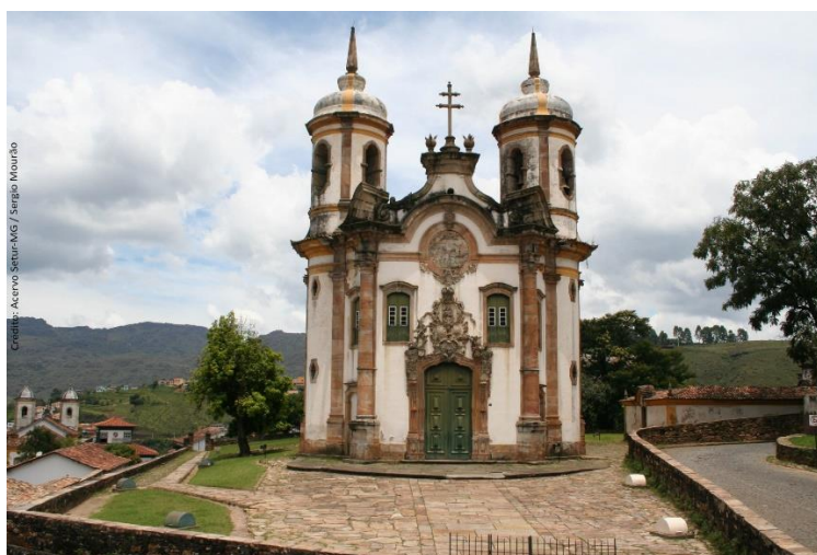
Figura 3: Igreja São Francisco de Assis, Ouro Preto