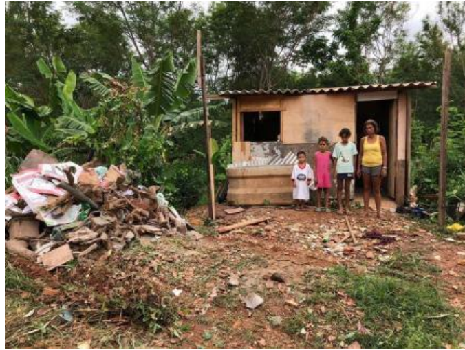
Figura 1: Foto retirada da notícia do site gazeta digital

Fonte: https://www.gazetadigital.com.br/editorias/cidades/depois-de-despejo-familia-mora-em-barraco-doado-e-precisa-de-ajuda/598219