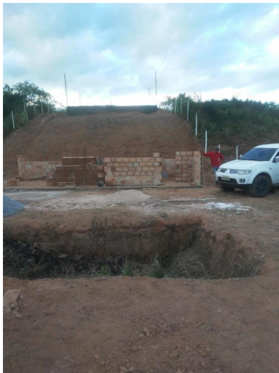
Figura 9: Foto tirada de dentro do terreno