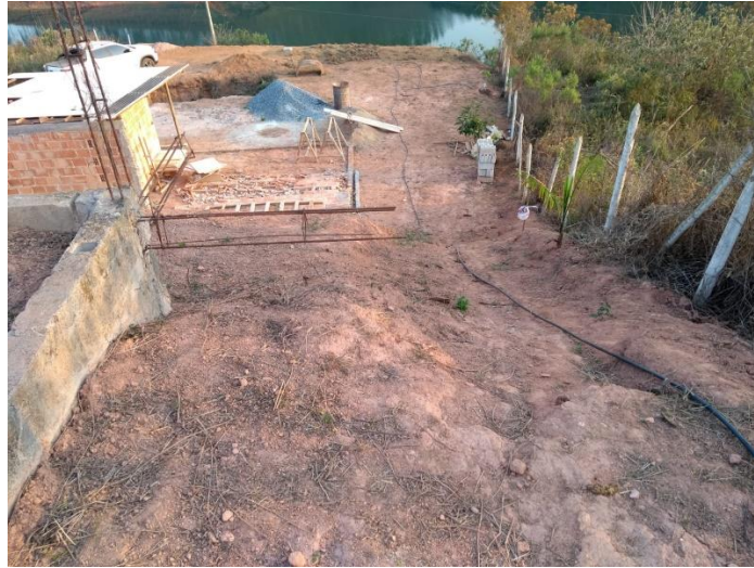
Figura 8: Foto tirada de dentro do terreno