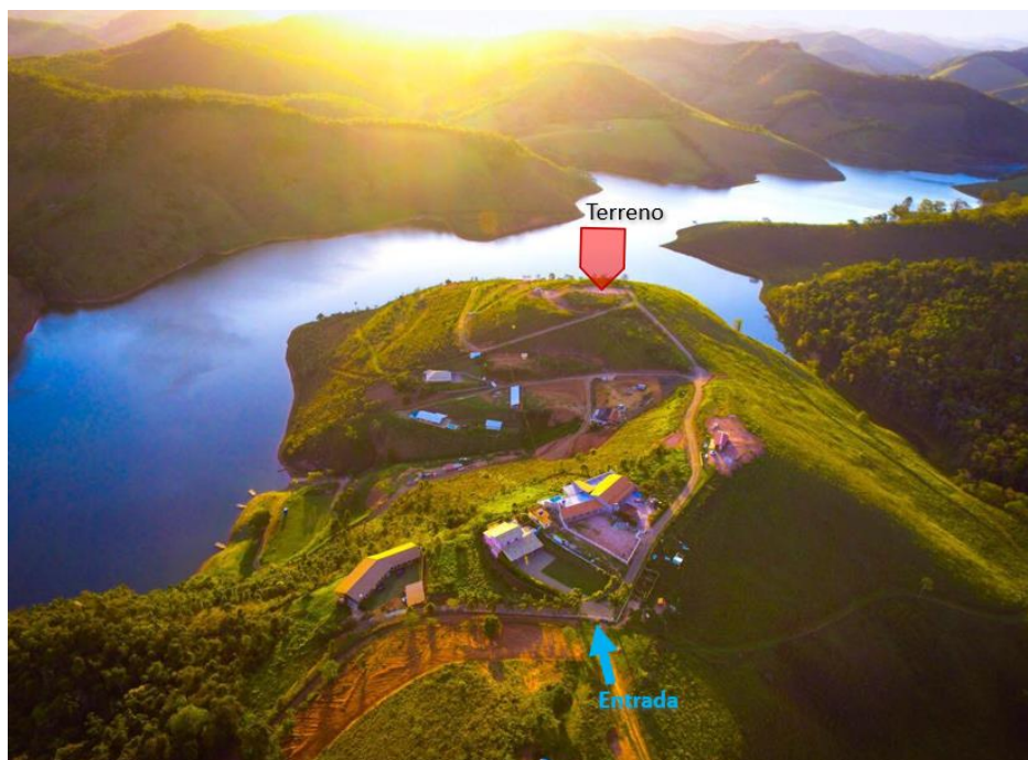
Figura 7: Localização do condomínio com o terreno