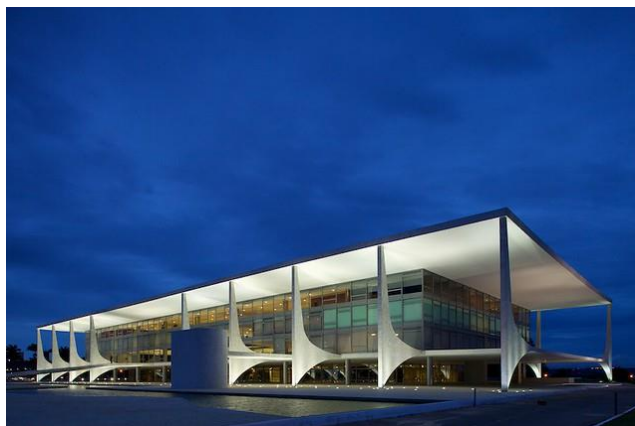
Figura 5: Palácio do planalto em Brasília – Oscar Niemeyer