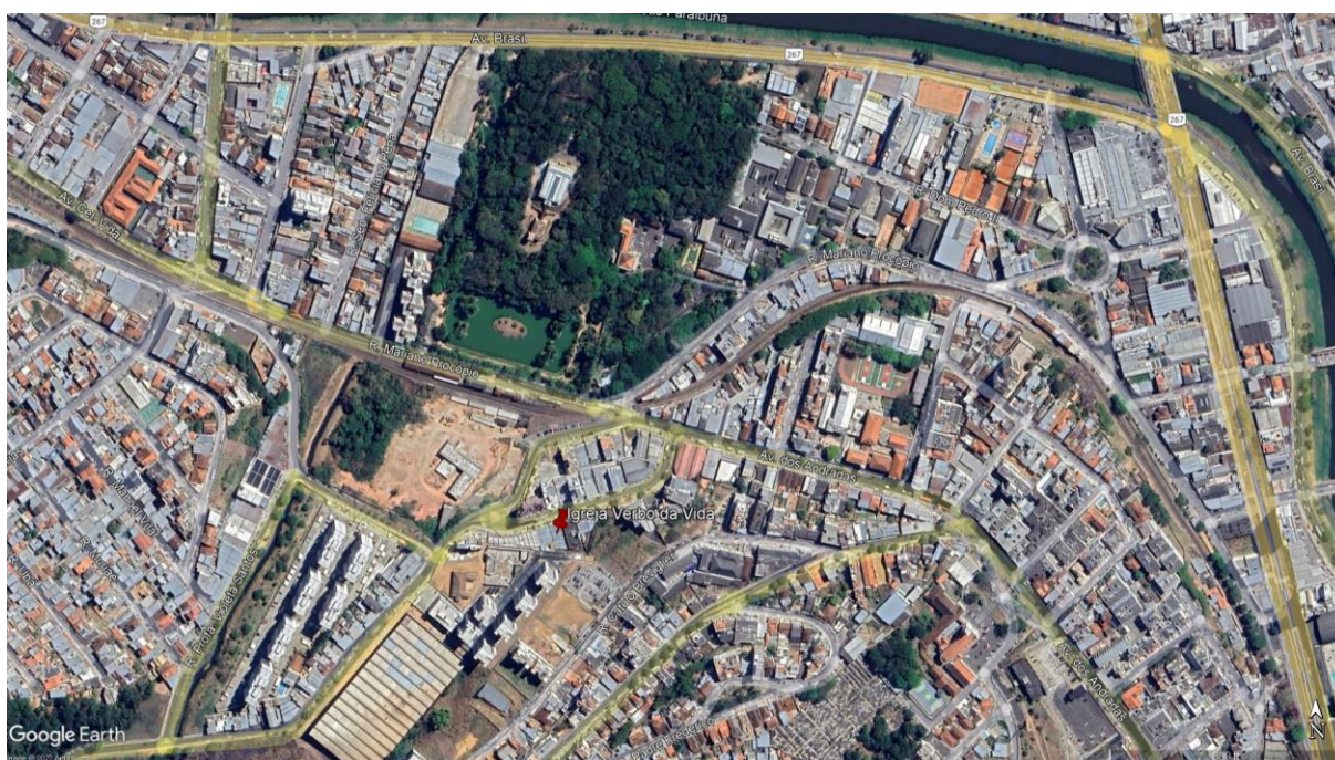
Figura 1: Localização da Igreja Verbo da Vida Juiz de Fora

Fonte: Google Earth Pro 2022, acessado em 07 de dezembro de 2022 – intervenções da autora.