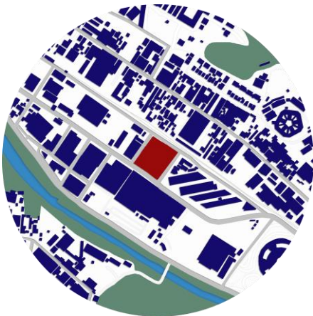
Figura 4: Localização do terreno para o projeto